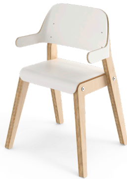
Barnestol Grow med armlene sh 37

Sittedybde 21 med fotstøtte. Art.nr. 146623. Sittedybde 28 Art.nr. 146632. Tillegg: fotstøtte.