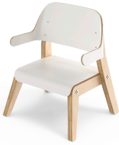
Barnestol Grow med armlene sh 21