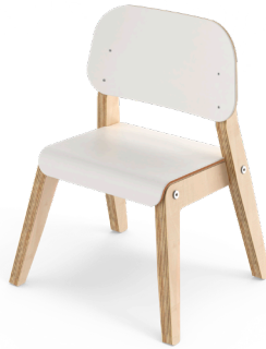
Barnestol Grow sh 28

Sittedybde 21. Art.nr. 146615. Tillegg: bøyle.