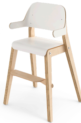
Barnestol Grow med armlene og fotstøtte sh 50

Sittedybde 21 med fotstøtte. Art.nr. 146623. Sittedybde 28 Art.nr. 146632. Tillegg: fotstøtte.