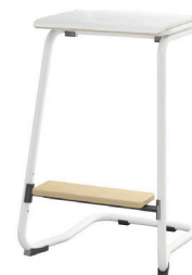
Krakk Tilgjengelig med både lite og stort sete i sitte høyde 62 cm.