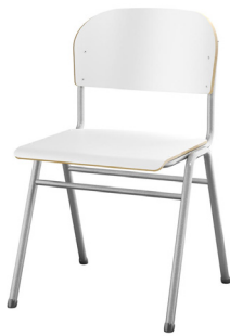
4 ben lav Tilgjengelig med stort sete i sitte høyde 45 cm.