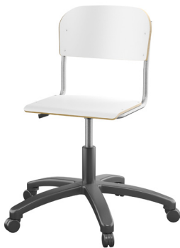
5 kryss plast Tilgjengelig med både lite og stort sete i sitte høyde 38-51 cm. Med hjul eller glideføtter.