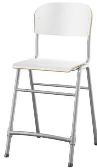
4 ben høy Tilgjengelig med både lite og stort sete i sitte høyde 54 og 65 cm.