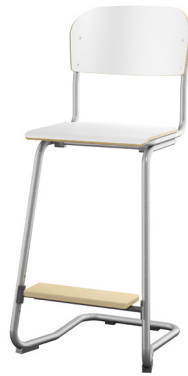
C-understell høy Tilgjengelig med lite sete i sitte høyde 45, 50 & 63 cm og justerbart 57/63. Stort sete tilgjengelig i sitte høyde 63 cm og justerbart 57/63.