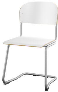
C-understell lav Tilgjengelig med stort sete i sitte høyde 45 cm.