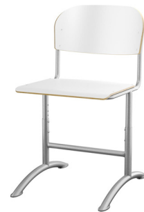
Justerbar understell Tilgjengelig med både lite og stort sete i sitte høyde 45 cm.