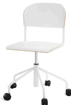
5 kryss metall Tilgjengelig med både lite og stort sete i sitte høyde 45-56 cm.