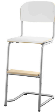
L-undersell høy justerbar Tilgjengelig med både lite og stort sete i sitte høyde 45/63 cm.